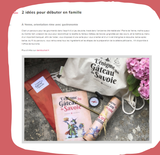
Article course d'orientation - site du Département publié le 16/06/23 avec zoom Gâteau de Savoie