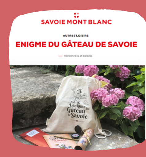
Présence annuelle sur Savoie Mont Blanc